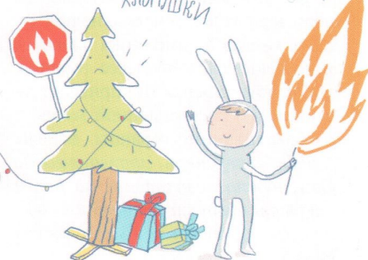
Иллюстрация: Елена Сидорова

БЛИЗКО ЕЛКИ НЕЛЬЗЯ ЗАЖИГАТЬ СВЕЧИ И БЕНГАЛЬСКИЕ ОГНИ, ВЗРЫВАТЬ ХЛОПУШКИ