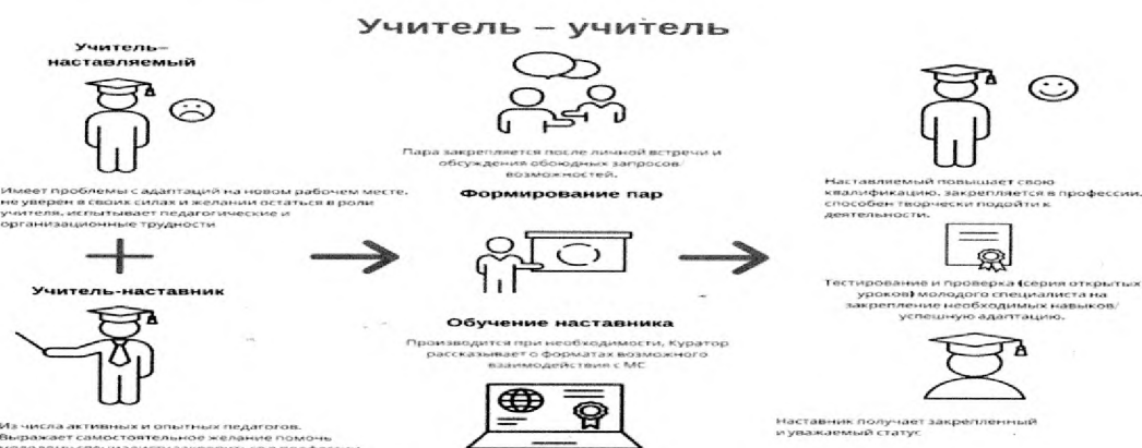
Рис. 2. Графическое представление реализации программы наставничества по форме «учитель – учитель».